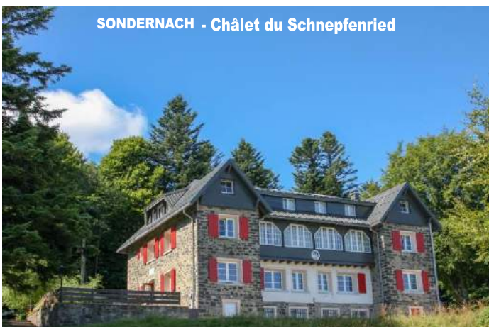
SONDERNACH - Châlet du Schnepfenried

Les leaders de demain se trouvent parmi les jeunes d'aujourd'hui