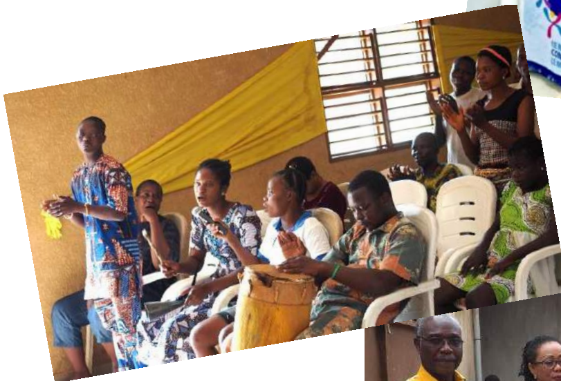
TOKAN - Centre d'accueil des malades mentaux

BOHICON - Visite du chantier de réhabilitation du centre d'accueil Ibaretta. Ce projet réunit 16 clubs Rotary, 3 districts et les 2 sections du CIP France-Bénin. Il bénéficie d'une subvention mondiale de la Fondation Rotary. (Photo ci-contre)