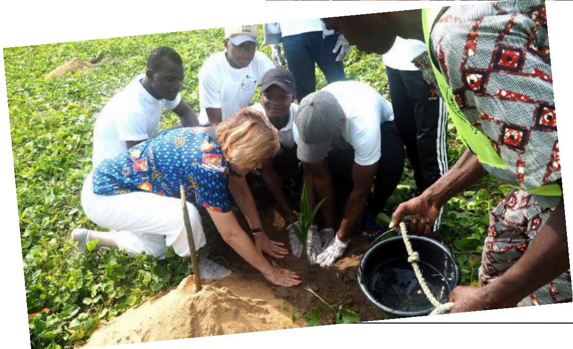
TOGBIN - Plantation de cocotiers