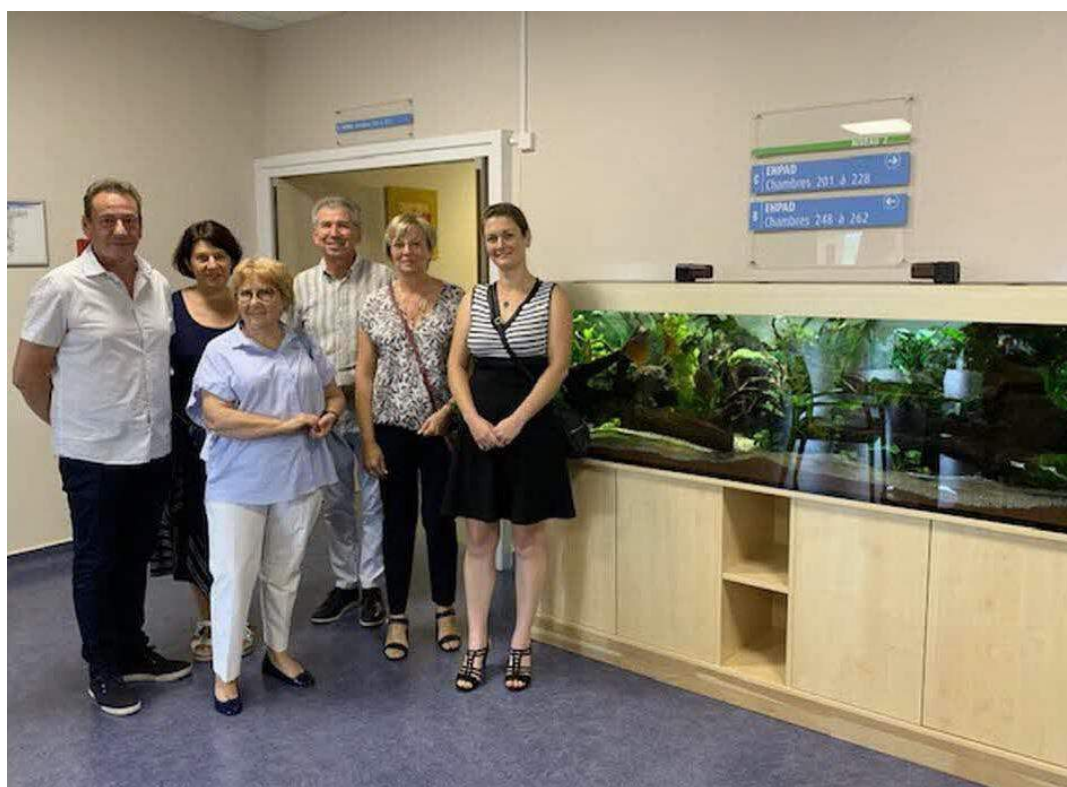
Le Rotary Club de Sarre-Union a financé un aquarium de l'Ehpad de Sarralbe.

Il permet l'achat d'un aquarium qui relève de la volonté des usagers. Cet aquarium aux couleurs vives équipe un salon d'étage, soit un lieu de rencontre des résidents et des familles. Il a été démontré que la contemplation d'un aquarium influait sur le bien-être psychologique et physique des résidents, et ceci par le ballet permanent et paisible des poissons. Cette action a pu être financée grâce à la Fondation du Rotary International mais surtout à la faveur de la