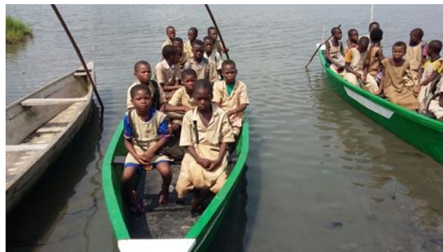
Fourniture de barques pour les écoliers de Cocou-Codji sur le lac Ahémé (2017)