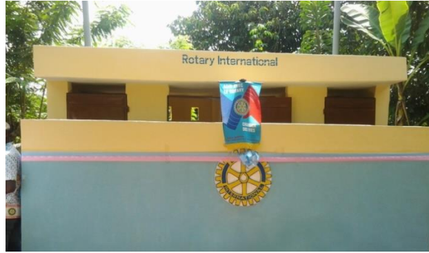
Construction de latrines à Houssa et Tokpagbo (2014)

100 kits de naissance pour 100 mères à l'Hopital de Zone d'Abomey-Calavi (2014/2015) et 75 kits pour la maternité de Kpota (2019/2020)