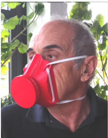
La réalisation de ce masque, créé par Georges Jeambrun, revient à 30 €. En contrepartie de ce masque qui sera donné gratuitement, un don peut être fait à l'association « Les Invités au Festin ».

Il vous sera établi un reçu fiscal à hauteur de 66 % de la valeur de votre don. Une notice d'emploi est