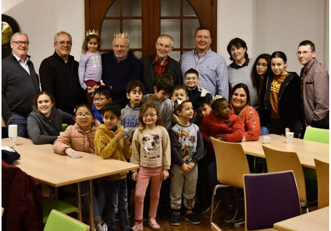
Traditionnelle photo de famille après le partage de la galette