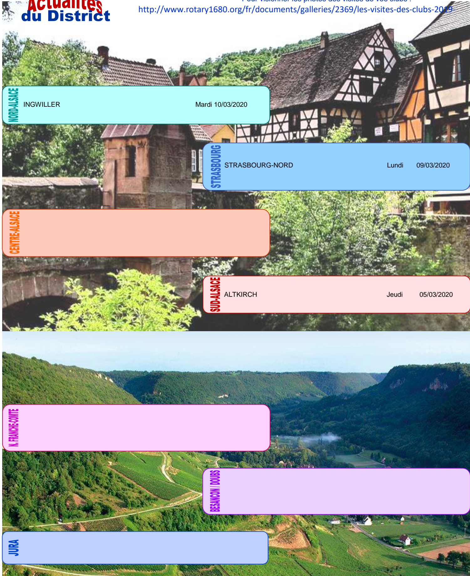
NORD-ALSACE INGWILLER Mardi 10/03/2020

Pour visionner les photos des visites de vos clubs : http://www.rotary1680.org/fr/documents/galleries/2369/les-visites-des-clubs-2019