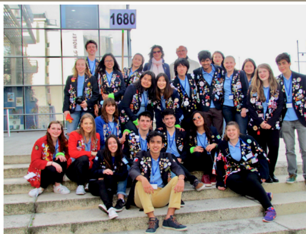
JRJ , La Rochelle 24 au 26 mars ,rencontres de la jeunesse du monde . Un temps fort pour nos students, responsables et gouverneurs présents